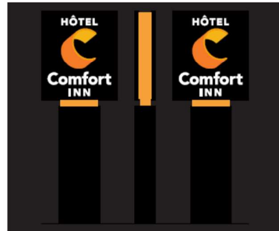
VUE DE NUIT